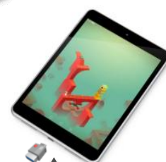
Connecteur Type C Nokia N1