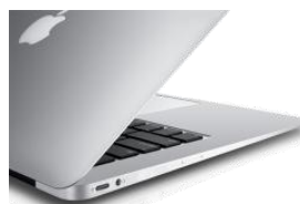
Connecteur Type C Apple MacBook